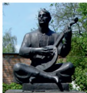
Пам'ятник козакові Мамаю в Переяславі- Хмельницькому