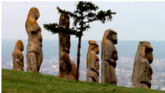
Кам'яні баби на острові Хортиця

* Байрак — яр, порослий лісом, чагарником.