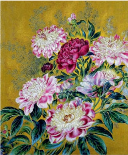
Катерина Білокур. Півонії (репродукція)

Три картини Білокур — «Цар-Колос», «Берізка» і «Кол-госпне поле» демонстрували на Міжнародній виставці в Парижі (1954), де їх побачив і високо оцінив Пабло Пікассо. Ці твори принесли їй світову славу. В останні роки життя художниця створила чудові картини «Півонії», «Букет квітів», «Квіти і овочі», «Натюрморт».