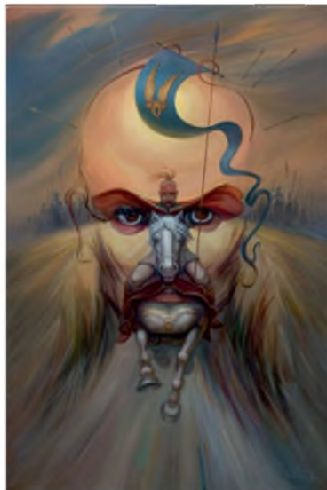
Олег Шупляк. «Іду на Ви!» Святослав Хоробрий (репродукція)