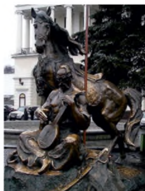
Пам'ятник козакові Мамаю в Києві

Здавалось би — дозвілля і розвага, та варто придивитися пильніше: у вправах цих по літерці звитяга майбутніх перемог літопис пише.