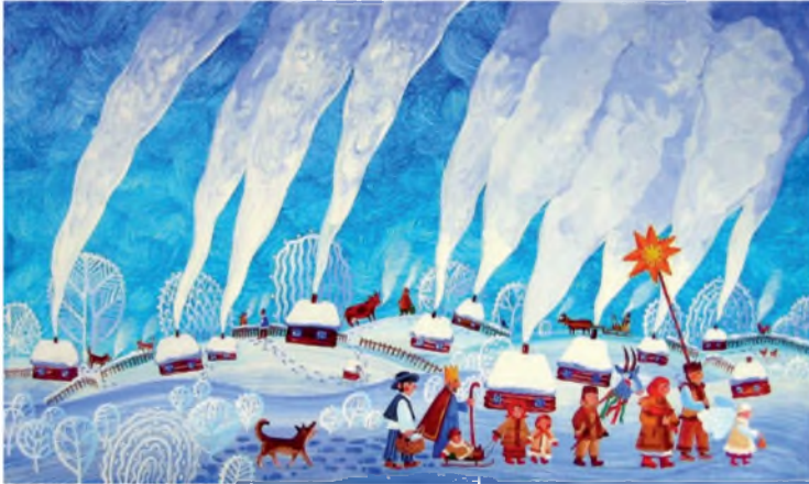
Ольга Кваша. Колядки (репродукція)